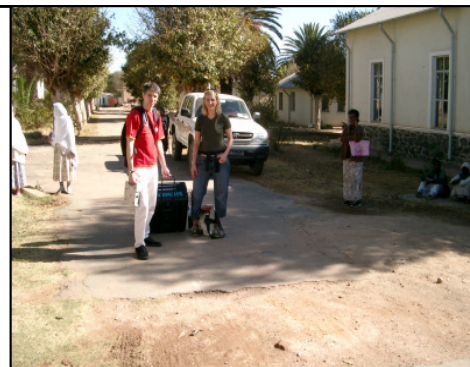
Abb. 1: Kinderkardiologen bringen das Echogerät zur kinder-kardiologischen Ambulanz.

Methode: Die von uns entwickelte Befundungssoftware (GO-Kinderecho) wurde für den mobilen Einsatz weiterentwickelt. Die Bilder und Filmsequenzen des Echogerätes wurden über ein „local-area-network“ im DICOM-Format (Digital Image and Communication in Medicine) akquiriert und auf dem Notebook gespeichert. Dort können sie für eine Email Kommunikation in das Motion-Picture-Expert-Group (MPEG) Version 4 Format konvertiert werden. Der Bericht wird aus definierten Textblöcken zusammengestellt, entsprechend dem DICOM Structured Report. ICD Diagnosen werden im Hintergrund zugeordnet. Alle Befund- und Bilddaten können nach der Rückkehr in die eigene Datenbank importiert werden.